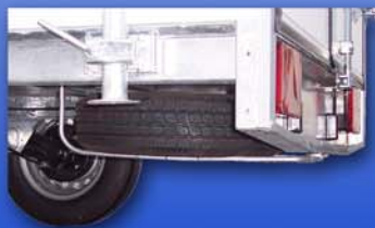
Roue de secours et support